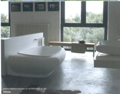
Baden hoeven niet per se rechthoekig te zijn. Interop