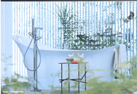
Axor / Hansgrohe