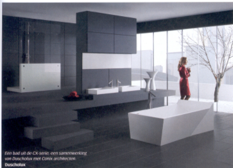
Een bad uit de Cx-serie, een samenwerking van Duscholux met Conix architecten Duscholux