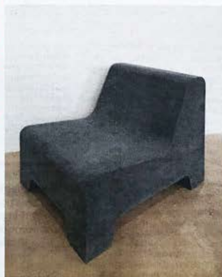
Betonachtig schuilmeubel van Cooloo.

De Nederlandse startup Cooloo vond een interessante oplossing. Van reststromen als denim, koffieprut, marmergruis of leer worden hoogwaardige coatings gemaakt. Deze toplaag wordt over afgedankte meubels gespoten, die een nieuwe coole look krijgen van valse jeans of kurk. Aan het einde van de cyclus kan de eco-coating zelf ook weer worden gerecycled. Inmiddels heeft Cooloo een