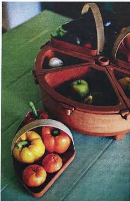
De terracotta voedselschaal van House of Thol.