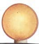
Luna, een ontwerp van de Nederlandse biodesigner Lionne van Deursen. Foto Lionne van Deursen

september. De reguliere 61ste editie staat nu weer gepland voor april 2022. Naast de meubelbeurs Salone del Mobile waren er merkpresentaties en groepsexposities op diverse locaties in de Milanese binnenstad.